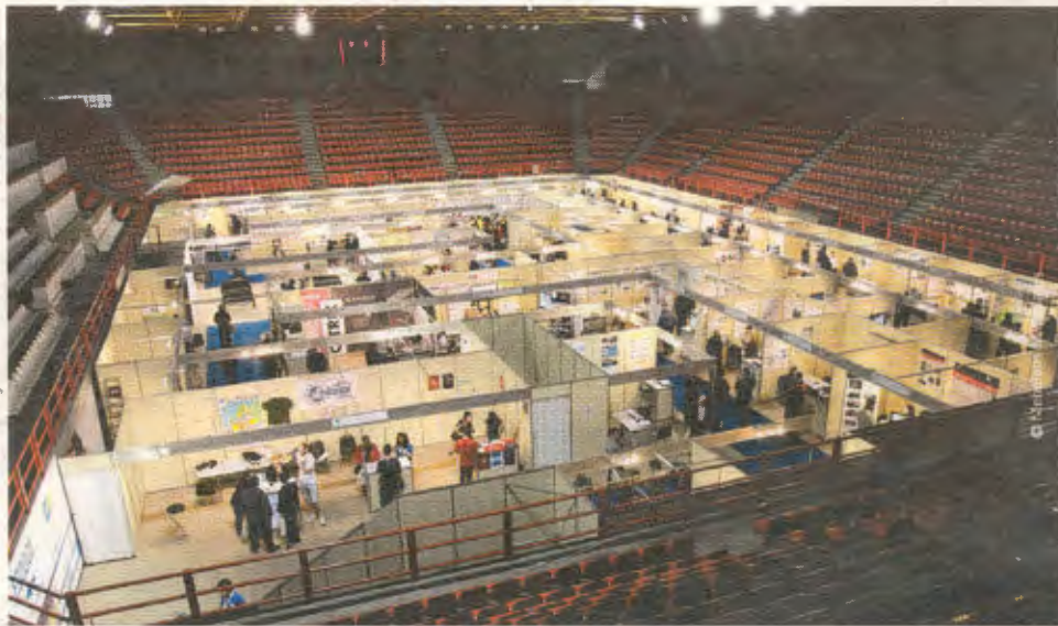
Προχωρημένα πρότζεκτ, πειραματικές συσκευές, γκάτζετ, συστήματα. Όλα με υπογραφή πυρήνων από την Πάτρα.

«Δίνουμε τη δυνατότητα σε πτυχιακούς φοιτητές να ασχο-